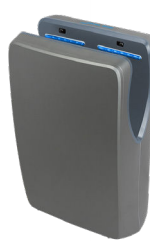
AA24950 8427950360626 Acabado Grafito