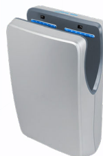
AA24550 8427950360602 Acabado Plateado