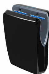
AA24650 8427950360619 Acabado Negro