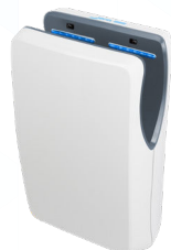
AA24050 8427950360596 Acabado Blanco